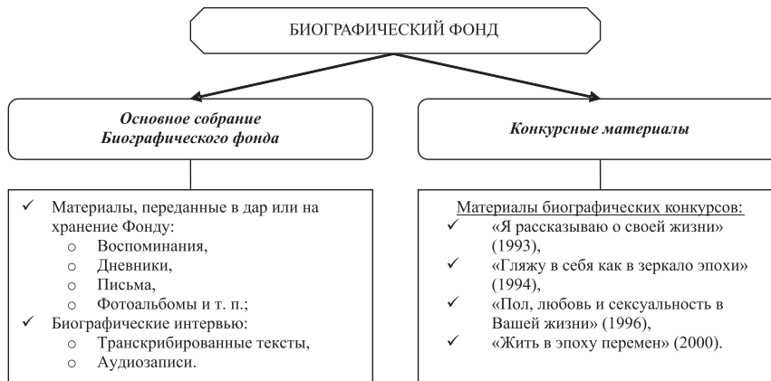
Схема 1. Структура Биографического фонда

Вторая часть Фонда представляет собой собрание биографических текстов, присланных на конкурсы, проводившиеся сотрудниками Социологического института РАН в период с 1993 по 2000 годы. Визуально структура БФ может быть представлена следующим образом (см. схему 1).