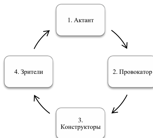
Рисунок 2. Неполная модель (отсутствует информатор)