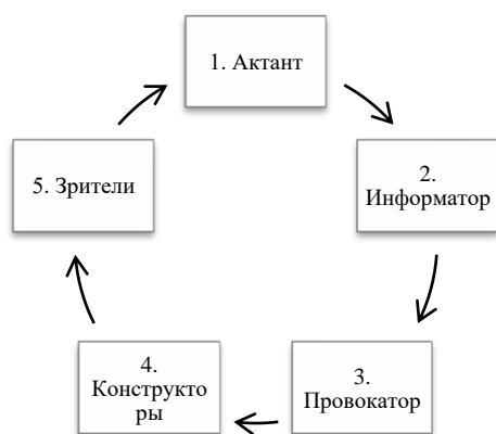
Рисунок 1. Полная модель