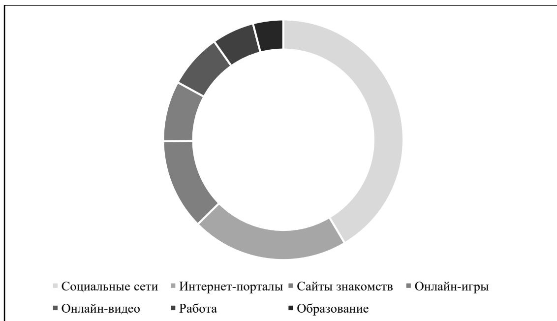
Рисунок 2. График распределения времени на различные ресурсы. Составлено по: [11]

Среднестатистический россиянин проводил в Интернете 123 минуты в день. Ниже представлен график распределения этого времени на различные ресурсы [11].